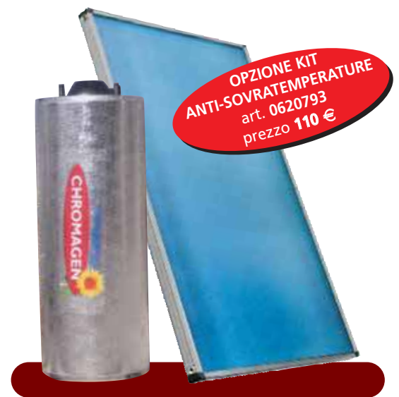
Le figure e gli schemi usati sono simbolici