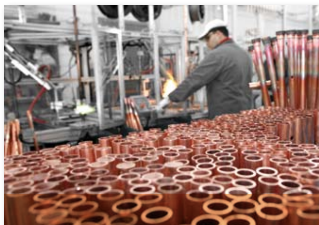
Saldatura raccordi a due postazioni