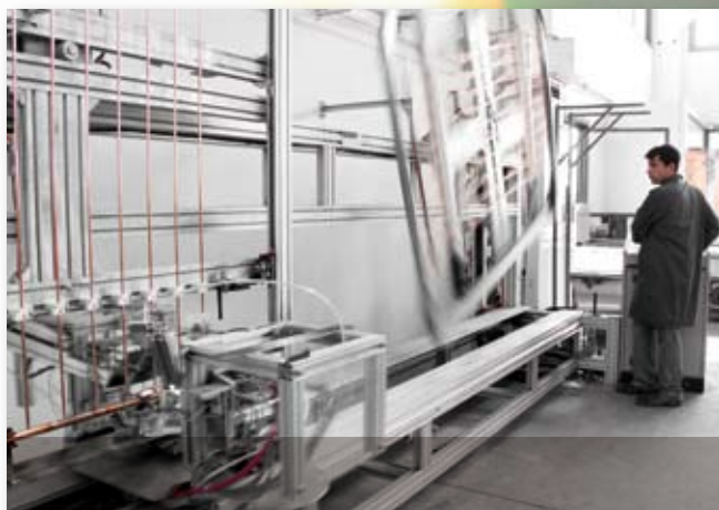
Saldobrasatura collettori solari