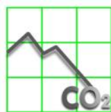
Riduzione Emissioni CO2